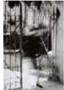
Foto di paesaggio